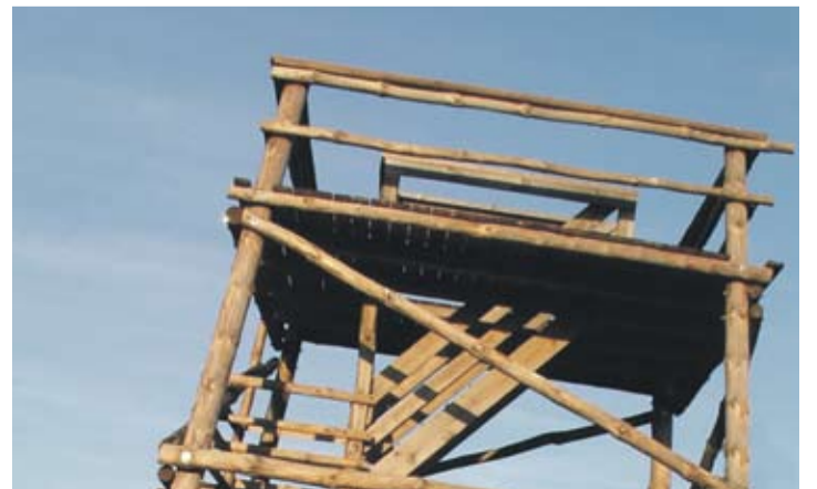
Peagi valmiv linnutorn.

Tõiv Jõul Pärnu Linnavalitsuse turismi vanemspetsialist