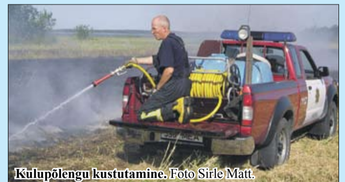
Kulupõlengu kustutamine.