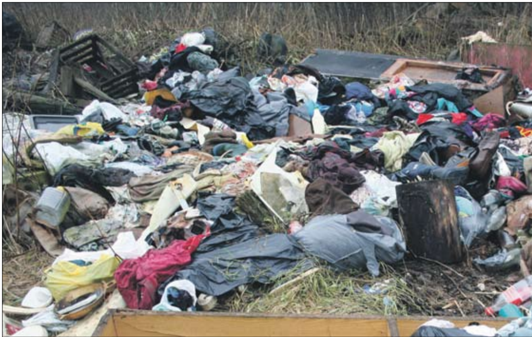
Talumatu korralgedus Eesti metsades.

Ettevõtmine sündis paari inimese äratundmisest, et olukord on jõudnud kriitilise piirini ja kui me praegu midagi ette ei