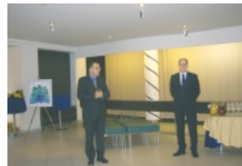
Anti välja juubelimark. 23. veebruaril esitleti Pärnu Teatris Endla vabariigi aastapäevale pühendatud juubelistpostmarki.