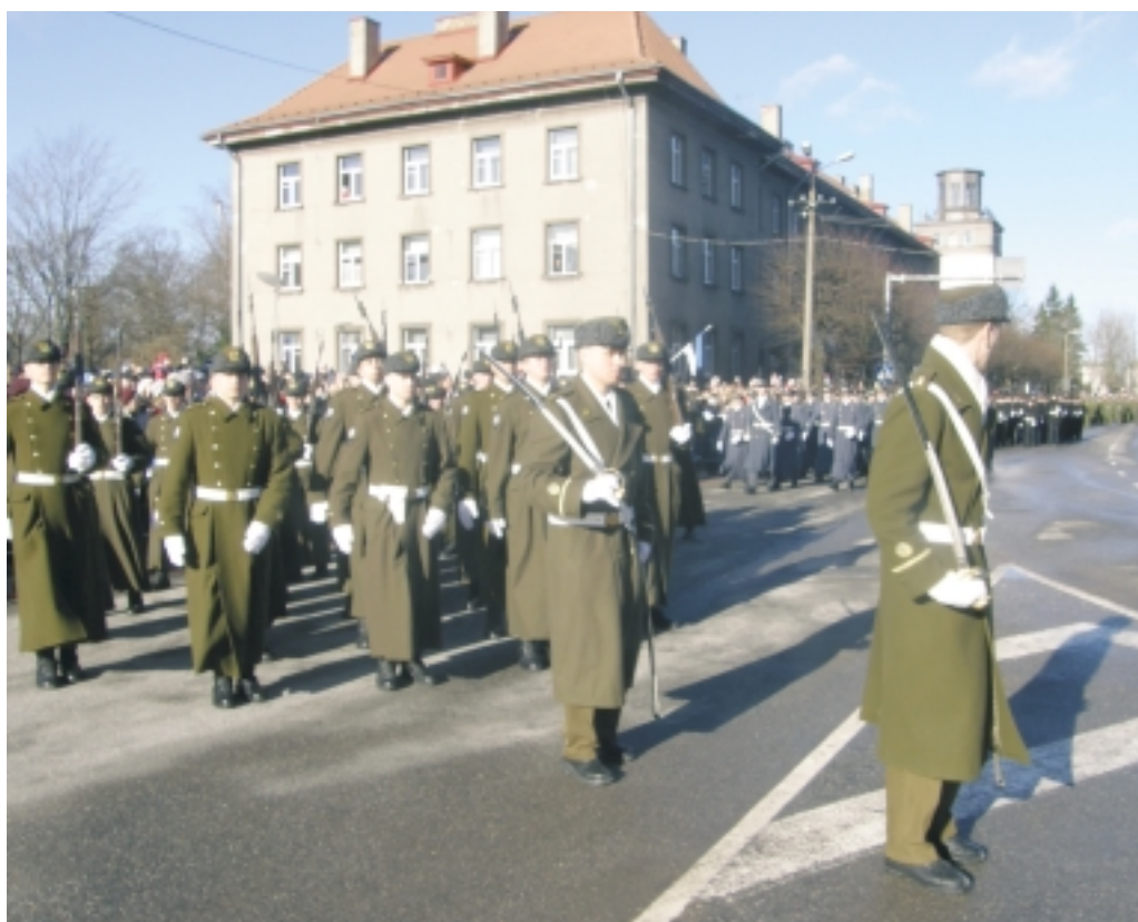
Vaata pilte http://www.parnu.ee/index.php?id=409