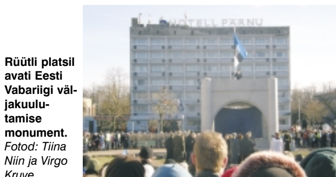
Rüütli platsil avati Eesti Vabariigi väljakuulutamise monument.

Iseseisuvpäeva paraad toimus Pärnu keskvaljakul. Osales 1081 kaitseväelast, pealtvaatajaid oli umbes 10 000. Soovijad said tutvuda sõdurite varustuse ja sõjatehnikaga, maitsta sõdurisuppi või külastada mereväe lipulaeva Johan Pitka.