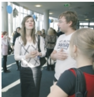
Pärnu Kontserdimajas vabariigi aastapäeva tähistamine noorteüritusega NOORTE VABARIIK.