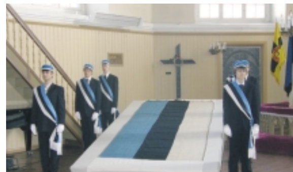
Elišabeti kirikus näitas Eesti Üliõpilaste Selts 1884. aastast pärit ajaloolist trikoolori.