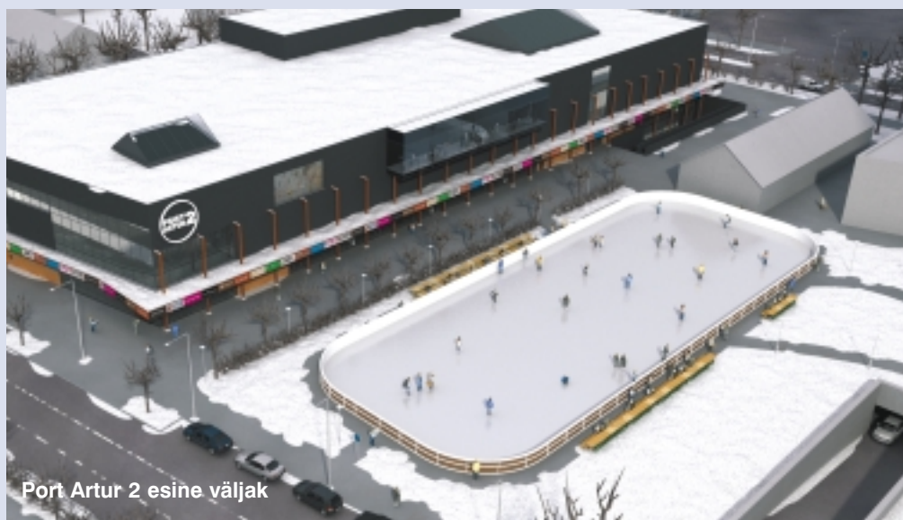
Port Artur 2 esine väljak

Lisamaterjalid http://www.parnu.ee/index.php?id=1503