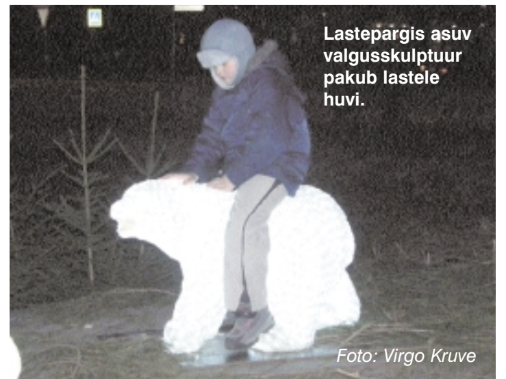
Lastepargis asub valguskulptuur pakub lastele huvi.