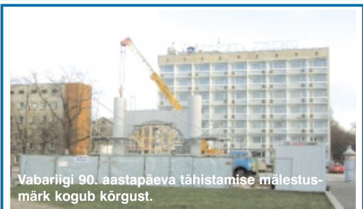
Vabariigi 90. aastapäeva tähistamise mälestusmärk kogub kõrgust.

oli näha kohvitassi taga logelevalid ametnikke. Nii see aga sugugi polnud. Silma jäi hoopis pidev töö inimeste ning linna murede lahendamisel. Kõik ametnikud, keda kohtasin, olid täiesti tavalised inimesed, kes tegid oma tööd nii tublisti kui vähegi suutsid. Ja neile, kes arvavad, et ametnike palgad on väga suured – ausõna ei ole, erasektoris võib teenida kordades rohkem. Astudes linnavalitsuse uksest välja, naeratasin – olin saanud jälle kogemuse võrra rikkamaks.