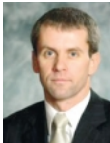
Jaanus Mutli Tallinna abilinnapea

Tallinn paneb ka 2008. aastal suurt rõhku ühistranspordile. Järgmisel aastal läheb liinile 25 bussi ning 7 uut liigendtrulli. Uute ühissõidukite ostu finantseerib linn järgmisel aastal 83,5 miljoni krooniga.