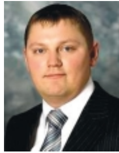
Deniss Borodits abilinneape

Uue aasta künnisel on kommunaal- ja keskkonnaametil Kristiine linnaosa elanikele edastada head sõnumid. Käesolevas jõulunumbris tutvustame saabuva aasta ehitus- ja taastamistöde tulevikuplaane Kristiines.