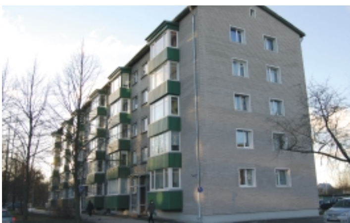
Kristiine linnaosa parim korteriühistu Tulika 66.

Korteriühistute sertifikaati saavad taotleda kõik korteriühistud. Sertifikaat väljastatakse kaheks aastaks.