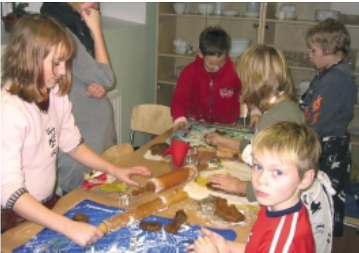
Kristiine laste päevakeskuses toimus piparkoogipäev

Toad said jõuluhõnguga ning hinged jõuluootusega täidetud. Osalejad jäid põnevusega järgmisi ühistegemisi ootama.