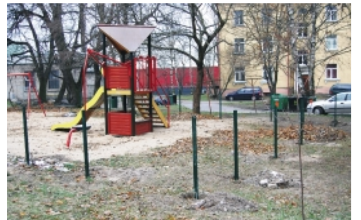
Laste mänguväljakute turvalisemaks muutmiseks rajatakse mänguväljakutele piirdeaiaid.