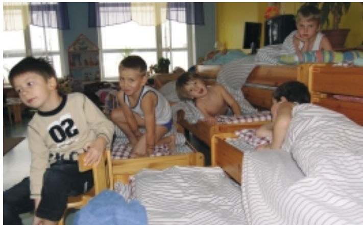
Päeval peab puhkama. Ettevalmistus puhkeajaks