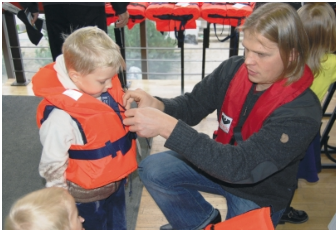
Päästevest võib päästa elu.