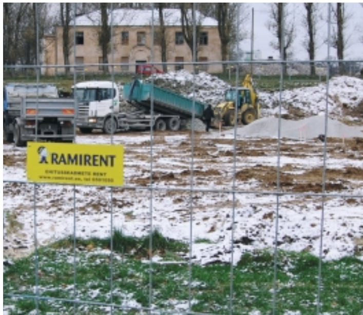
Ettevalmistustööd Tondi 55a, 55b ja Seebi 36 krundil on alanud.

Arhitektuuri- ja projekteerimisbüroo EA Reng arhitekt Martin Aunini sõnul peab tulevane maja sobima ümbrusega. "See peab sobima ajalooliste hoonete vahele, olema küllaltki liigendatud ja ehitatud väärriketest materjalidest," selgitas ta tulevase kompleksi väljanägemist.