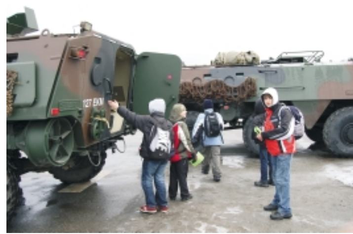
Suure huviga tutvusid kooliõpilased pataljoni transpordivahenditega.

Väljaõppekeskuses on ka kool, mis tegeleb kogu kaitseväe allohvitseride ja ohvitseride individuaalse logistilise väljaõppega. Lisaks toimuvad ka transpordivahendite ning soomukite tüübi- ja kasutuskoolitused instruktoritele. (Info: http://lppvok.mil.ee )