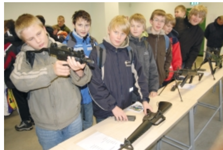
Eriti meeldis poistele relvanäitus.