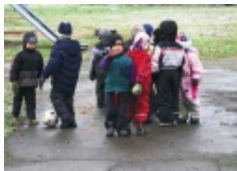
Õueaeg on lemmikaeg