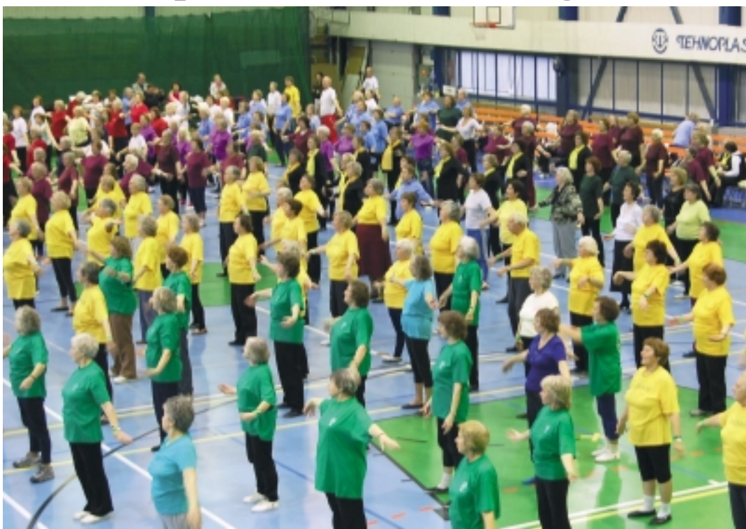
Tervisepäeva eesmärgiks on propageerida liikumist kui täisväärtusliku elu olulist osa.

Kristiine Linnaosa Valitsuse eestvedamisel on eakate inimeste tervisepäevi korraldatud juba alates 1999. aastast.