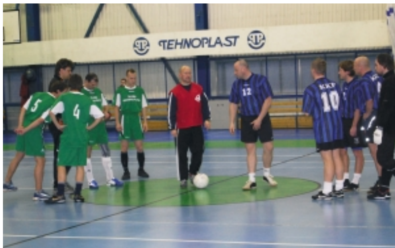
Turniiril osalesid Kristiine linnaosa asutuste võistkonnad

normaalaeg lõppes tulemusega 1:1 ja turniiri võitja selgus alles pärast penaltide löömist, seekord oli õnn Brem'i poolel ja tulemusega 5:4 võitis isadepäeva turniiri võistkond BREM. Jalgpallturniiri paremaid võistkondi autasustati karikate ja meenetega.