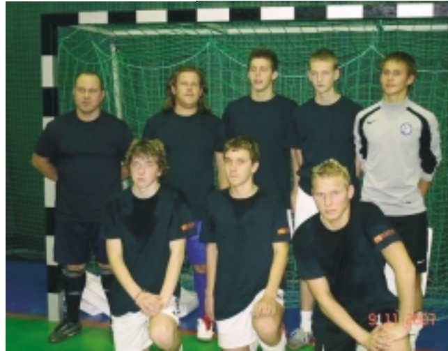
Isadepäeva saaljalgpalli turniiri võitja võistkond BREM.