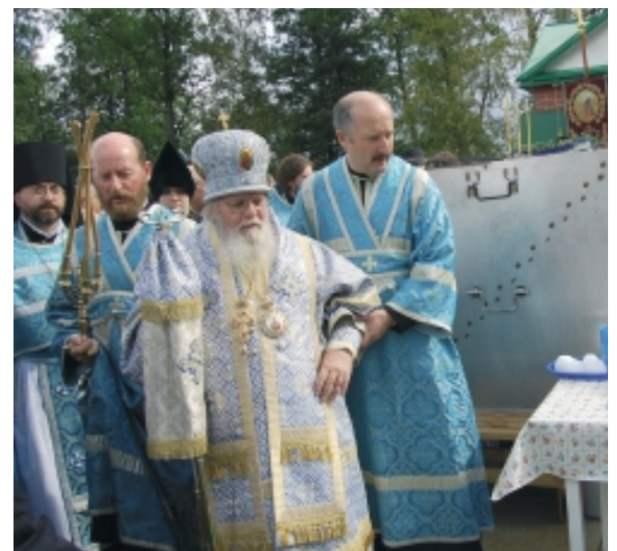
Крестный ход на Успенье в Пюхтице возглавил Митрополит Таллиннский и вся Эстонии Корнилий.

Жители Кристиине совершили в конце августа традиционную поездку в Пюхтицкий женский монастырь, чтобы отметить в святом месте большой православный праздник Успения пресвятой Богородицы, который ежегодно отмечается 28 августа. Нынешняя поездка в Пюхтицу была уже пятой по счету бесплатной ежегодной поездкой,