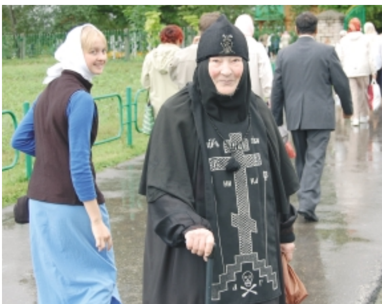
Жительница Пюхтицкого монастыря.