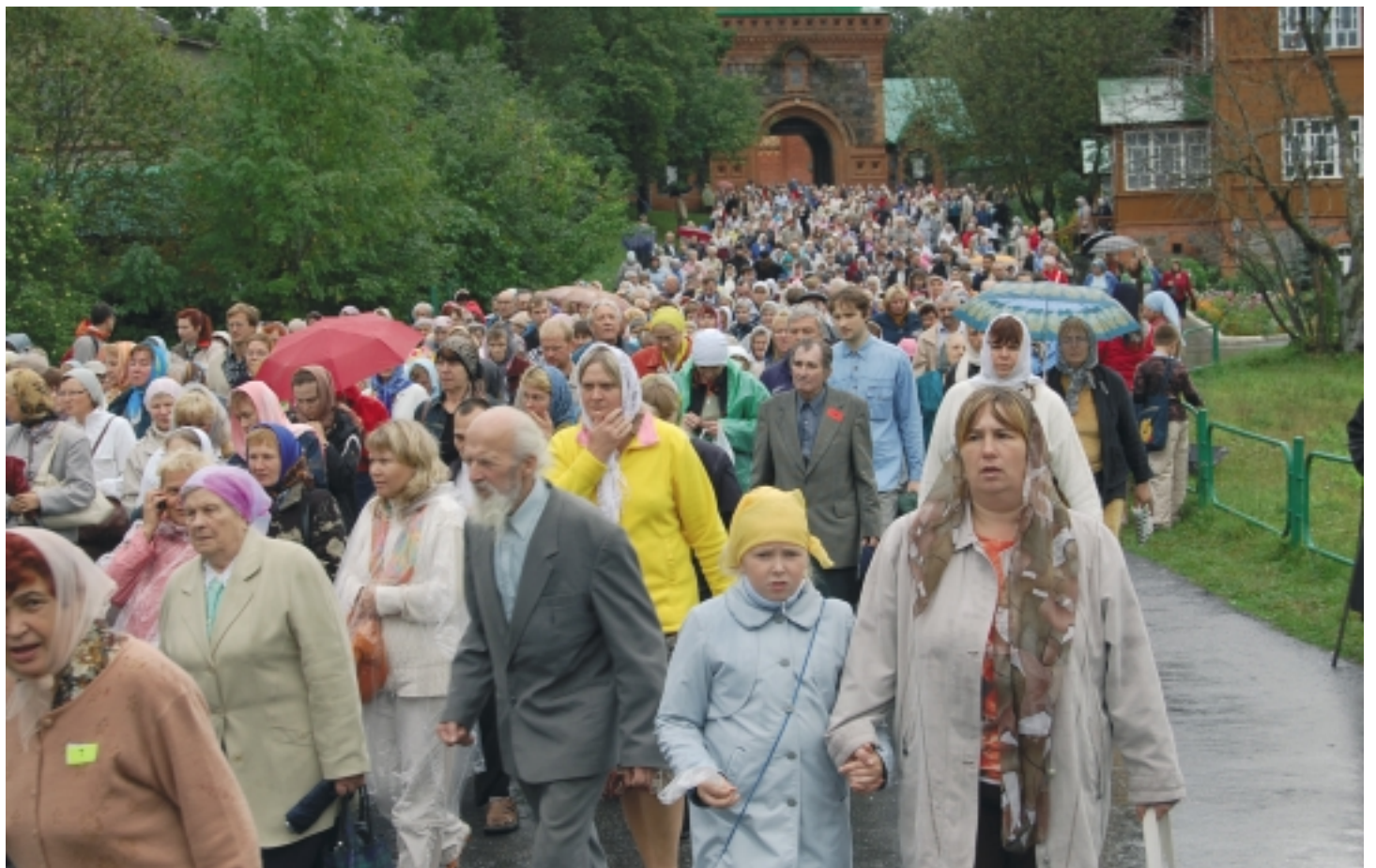
На Успенье в Пюхтицу прибыло не менее тысячи паломников.