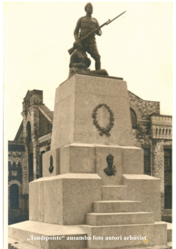
„Tondipoiste“ ausamba

Septembris 2006, kui toimusid International University Audentes peahoone soojustrassi kaevetööd, leiti ka ausamba vundamendi maaalune säilinud osa, mis oli paekivist 3 meetri paksune ja 7,5x8 meetri laiune. EKV pioneerid otsisid miiniosijatega vundamendi keha läbi, lootuses leida nurgakivi alla pandud silindrit. Kuid osutus, et vundamendi ülemine osa, umbes 1 meetri paksuses, oli