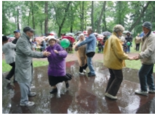
Publik tantsis ja laulis kaasa kontserdil, mis kestis üle tunni.