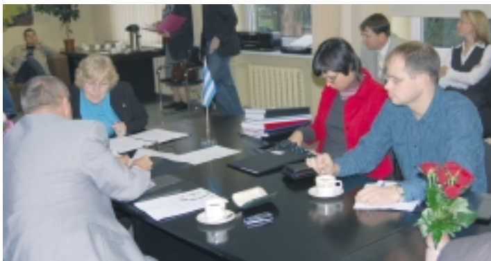
Kristiine Linnaosa Halduskogu koosolek 18. septembril.

juuni 1994 määrusest nr 11 ja võttes aluseks Tallinna Haridusameti 13. septembri 2007 kirja nr 2-5/1896 ja halduskogu liikmete ettepanekud Kristiine Linnaosa