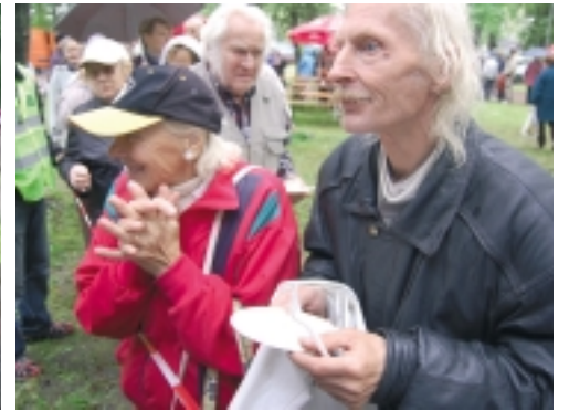
Ilm sekkus korraldajate plaanidesse, terve päeva sadas vihma, kuid see ei rikkunud osalejate ja korraldajate tuju.