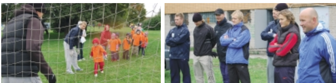
See on jalgpall!