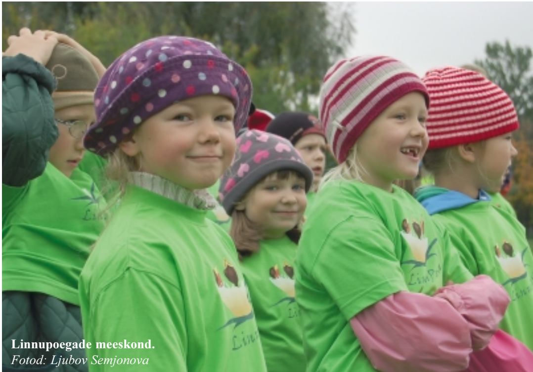
Linnupoegade meeskond.

Lapsed töid kohale Tallinna Autobussikoondisest tellitud bussid. Spordipäeval olid kavas erinevad mängud ja võistlused: jalgpall, täpsusvisked korvi, pallivise, köievedu, pendlijooks. Auhindadeks olid kõrremahlad, shokolaadimeдалid, kommid. Igale lasteaiale kinkis Andres Operi Jalgpallikool 2 palli. Üritust korraldasid Kristiine Linnaosa Valitsus, lasteadeade liikumisõpetajad ja Andres Operi Jalgpallikool.