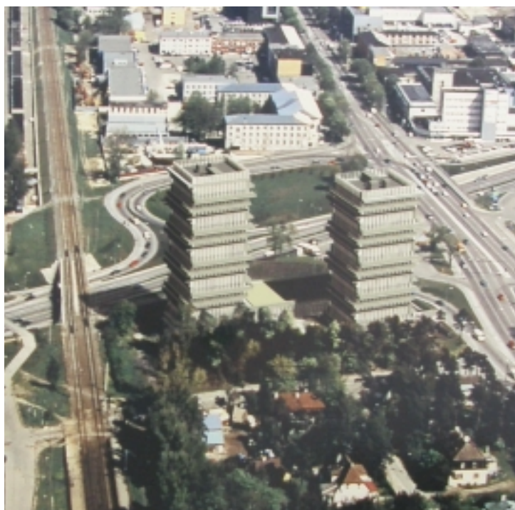
Kristiine tulevik – kas unistus või reaalsus?

4) Tulika 19 ja Sinika tänava nurga maa-ala eskiisiprojektile