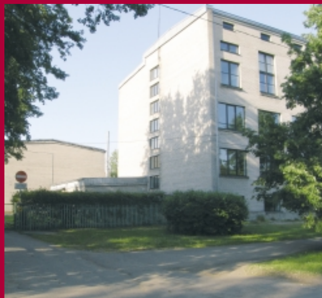
Hoone praegune seis ja sissepääs (parempoolsel fotol).

Kristiine Gümnaasiumi hoone vaade Tedre tänava poolt, kus halliga on vasakul märgistatud juurde ehitatav osa, millest saab peasissepääs. Eskiislahenduse autor Projektipea OÜ.