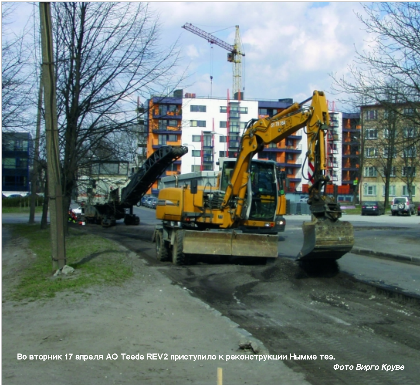
Во вторник 17 апреля АО Teede REV2 приступило к реконструкции Нымме теэ.

Реконструкция участка улицы Рязгу Тюве – Нымме теэ и прокладка дороги для велосипедистов занесена в программу объектов 2007 года. Скорее всего этим участком улицы займутся в конце года, на нем также будут установлены сточные колодцы и уличное освещение и проложены тротуары.