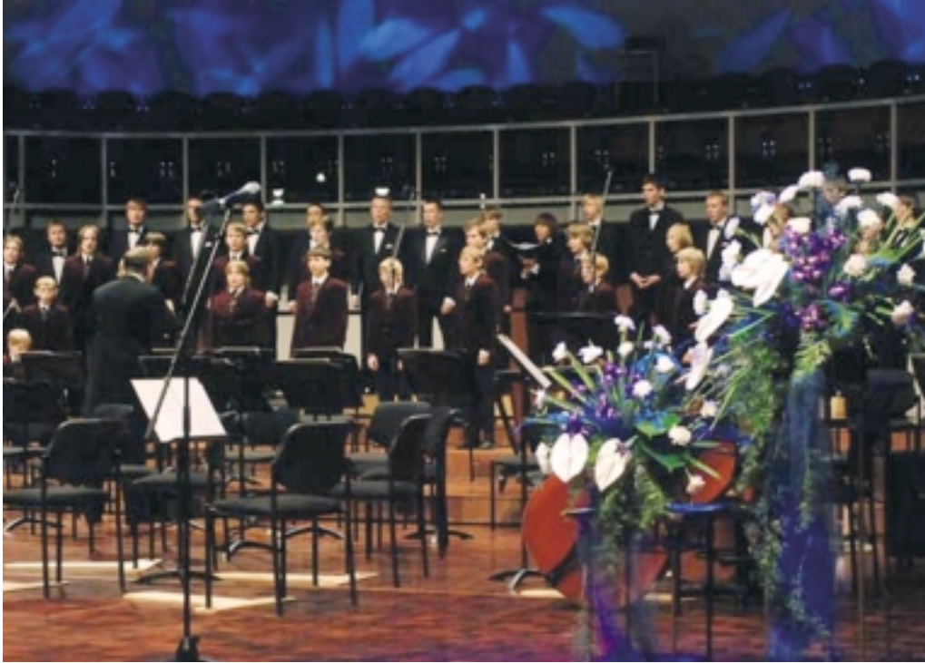
Laulab Estonia poistekoor.