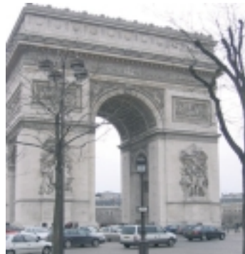
Pariis: meenutus prantsuse ehituskunstist, Triumfikaar.