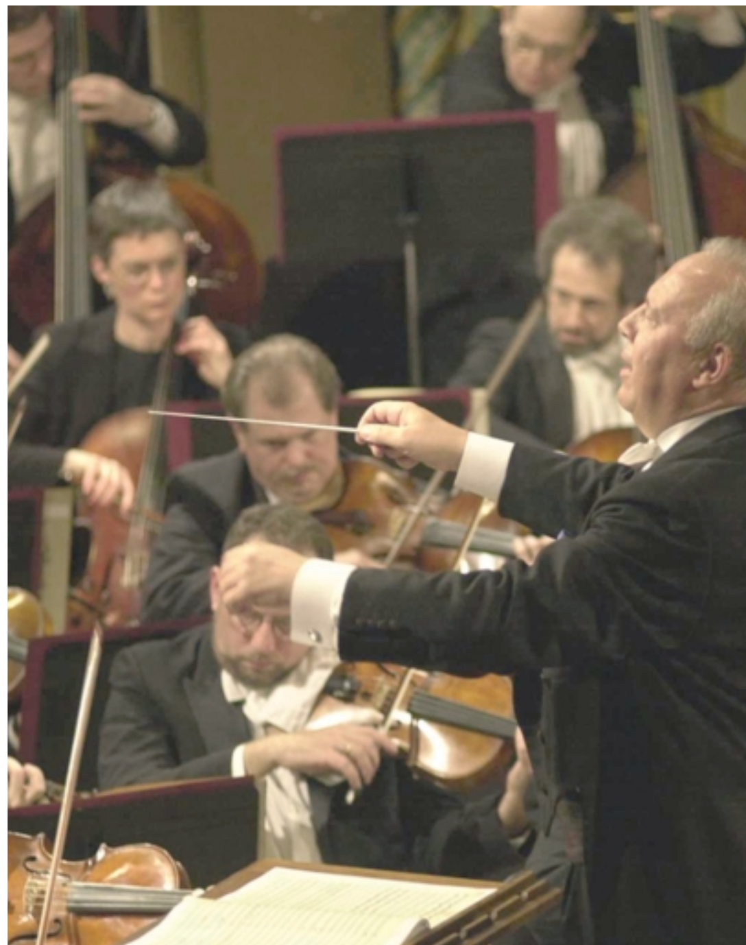
Esivanemate linn: Kuigi Neeme Järvi ise sündis Nõmmel, on tema esivanemad pärit Pärnust. See mälestus seob teda Pärnuga, kuigi mees ise on kuulus üle ilmmaa.