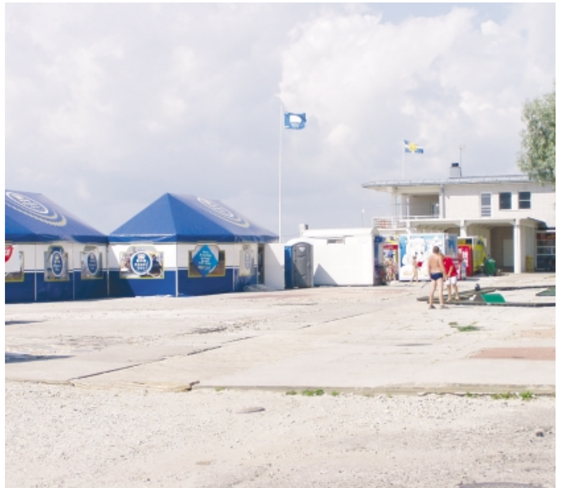
Talvel paranda vankrit: Linnavalitsus annab eel-läbirääkimistega pakkumise korras kuni kolmeks suveks rendile 60 müügikohta.