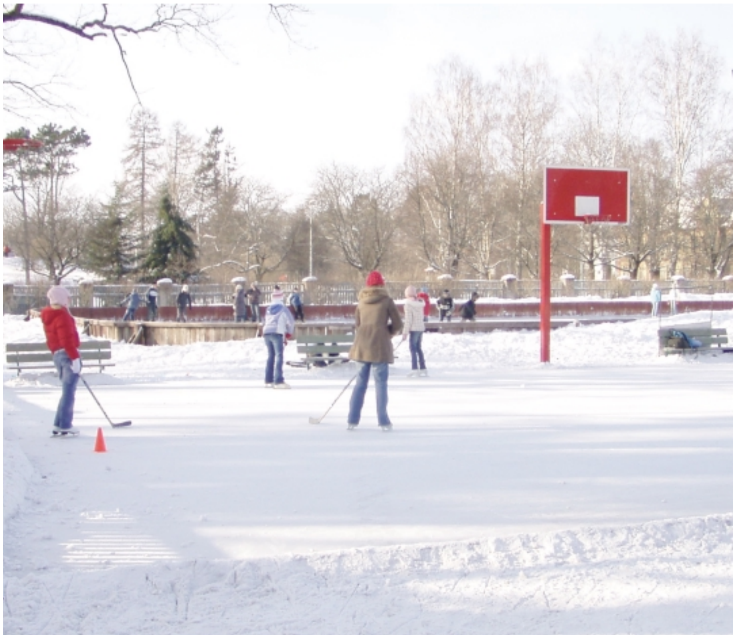
Tundub, et hetkel on pärnakatel kõigil rohkesti tahtmist ja huvi, sest lisaks toob selline spordi- ja vaba aja veetmise objektilinlasele uusi võimalusi, nagu siiani vähetuntud jäähoki või siis pea täiesti tundmatud jääkeegel ja iluuisutamine.

Suvepealinnas on mitu ilusat kohta kunstjääväljaku rajamiseks. Linnavalituse planeerimis-, kultuuri ja majandusosakond on asunud koos otsima võimalikku kunstjääväljaku asupaika, kuhu on võimalik luua liuväljakompleks koos infrastruktuuriga.