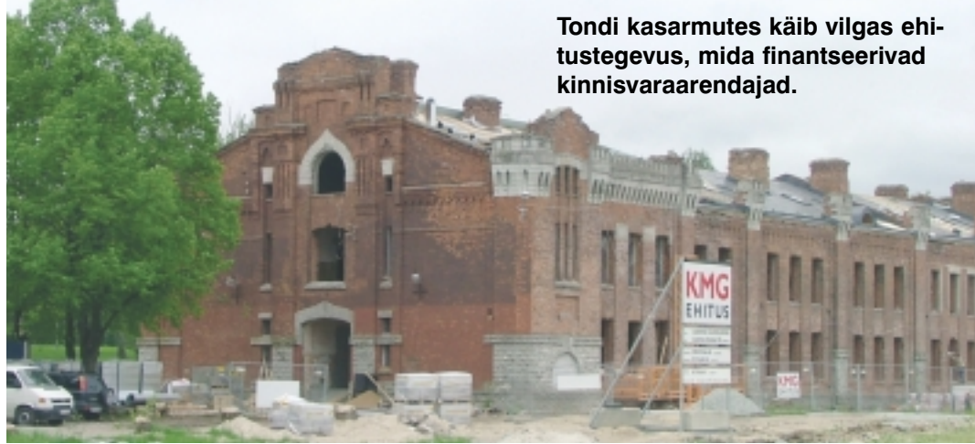
Tondi kasarmutes käib vilgas ehitustegevus, mida finantseerivad kinnisvaraarendajad.

Kristiine linnaosa arengukava koostamise eesmärk on luua alus plaanipärasele tasakaalustatud linnaosa arengule ja selle rahastamisele. Võttes aluseks linnaosa looduse, majanduse, sotsiaal- ja kultuurivaldkondade olukorra, Tallinna linna ja Kristiine linnaosa elanike avalikud huvid ning linna rahalised võimalused ja Tallinna arengudokumentides seatud sihid, esitatakse linnaosa üldine arenguline raamistik.