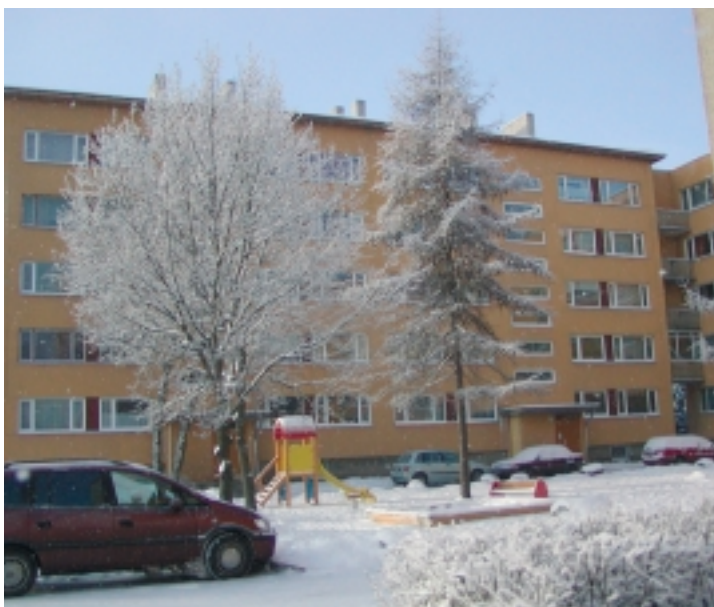
Tüve tn õu on jõutud juba korrastada.