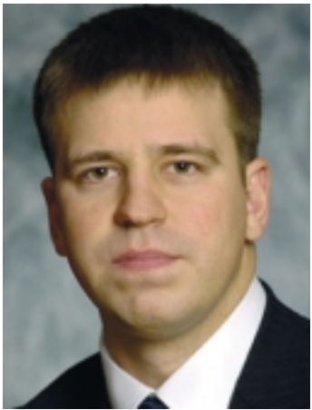
Jüri Ratas Tallinna linnaepea