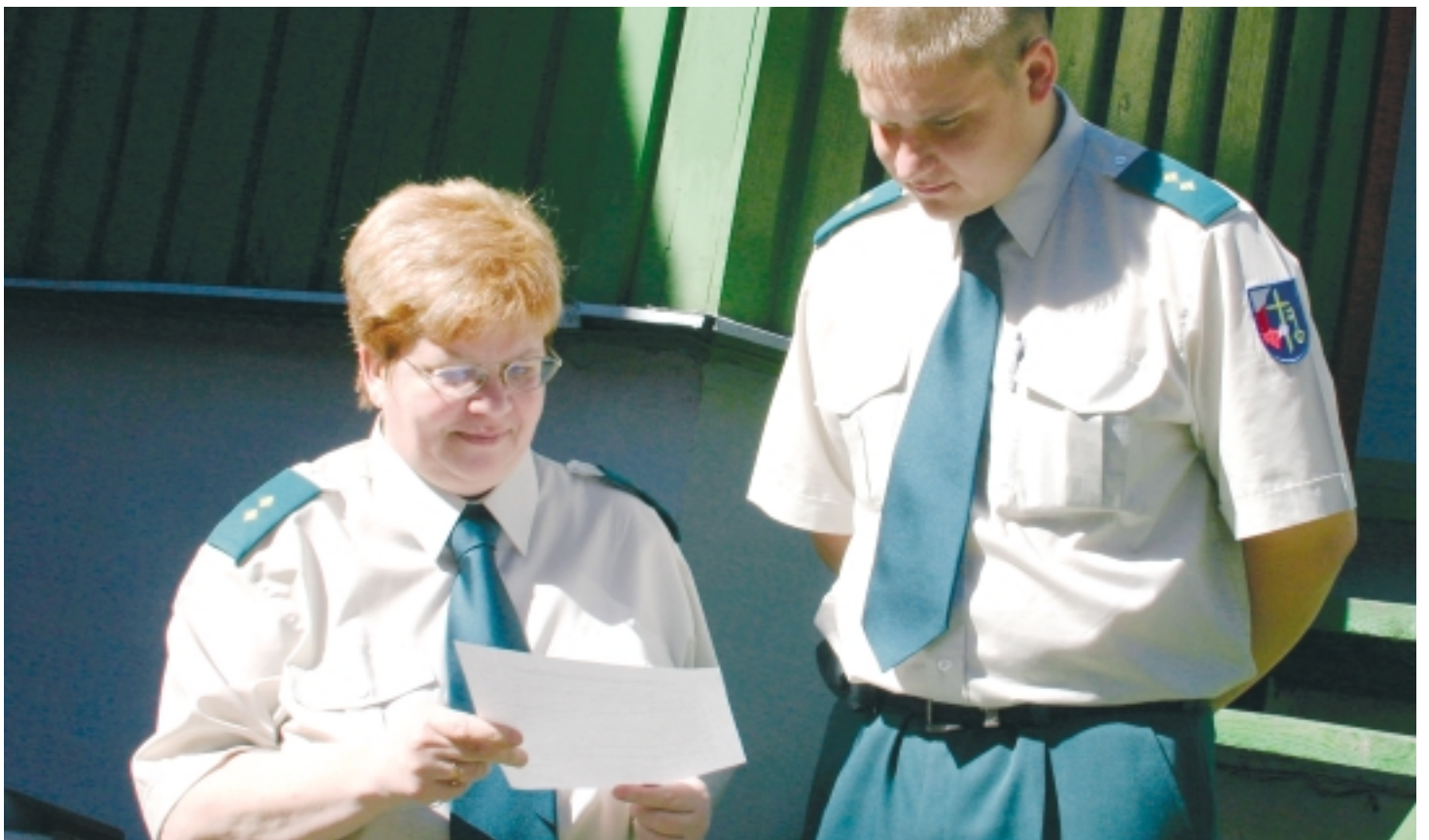
Hiljuti ametisse astunud linnapolitseinikud arutavad esimesi tööplaanide.

Linnakodanikud võivad pöörduda munitsipaalpolitsei poole küsimustega, mis puudutavad linna puhtust ja heakorda. Samuti saavad elanikud anda teada nendest ametisikutest, firmadest, ärdest, kinnistute ja majaomanikest, kes ei ole hooldanud ega koristanud oma territooriumi ümbrust ega pole teinud libeduse tõrjet kinnistuga piirneval kõnniteelõigul, või on jätnud koristamata jääpurikad, mis ohustavad jalakäijaid ja transporti. Kui pikemat aega on hooldamata, koristamata ja niitmata üldkasutatavad pargid, haljasalad või eraomanikele kuuluvad kinnistud, tuleks samuti linnapolitseid informeerida. Lisan veel siia juurde, et kui linnaterritooriumil on ebaseaduslikke prügi mahalaadimise kohti või kui prügi on pikemat aega ära vedamata või on märgatud haljasalade, teekatte, puude, põõsaste ja rohttaimede lõhkumist, kahjustamist või mittesihhipärast kasutamist. Linnapolitseile võib rääkida avaliku korra, heakorra ja koerte-kasside pidamise eeskirjade rikkumisest ja kõigest muust, mida linnakodanik peab vajalikuks munitsi-