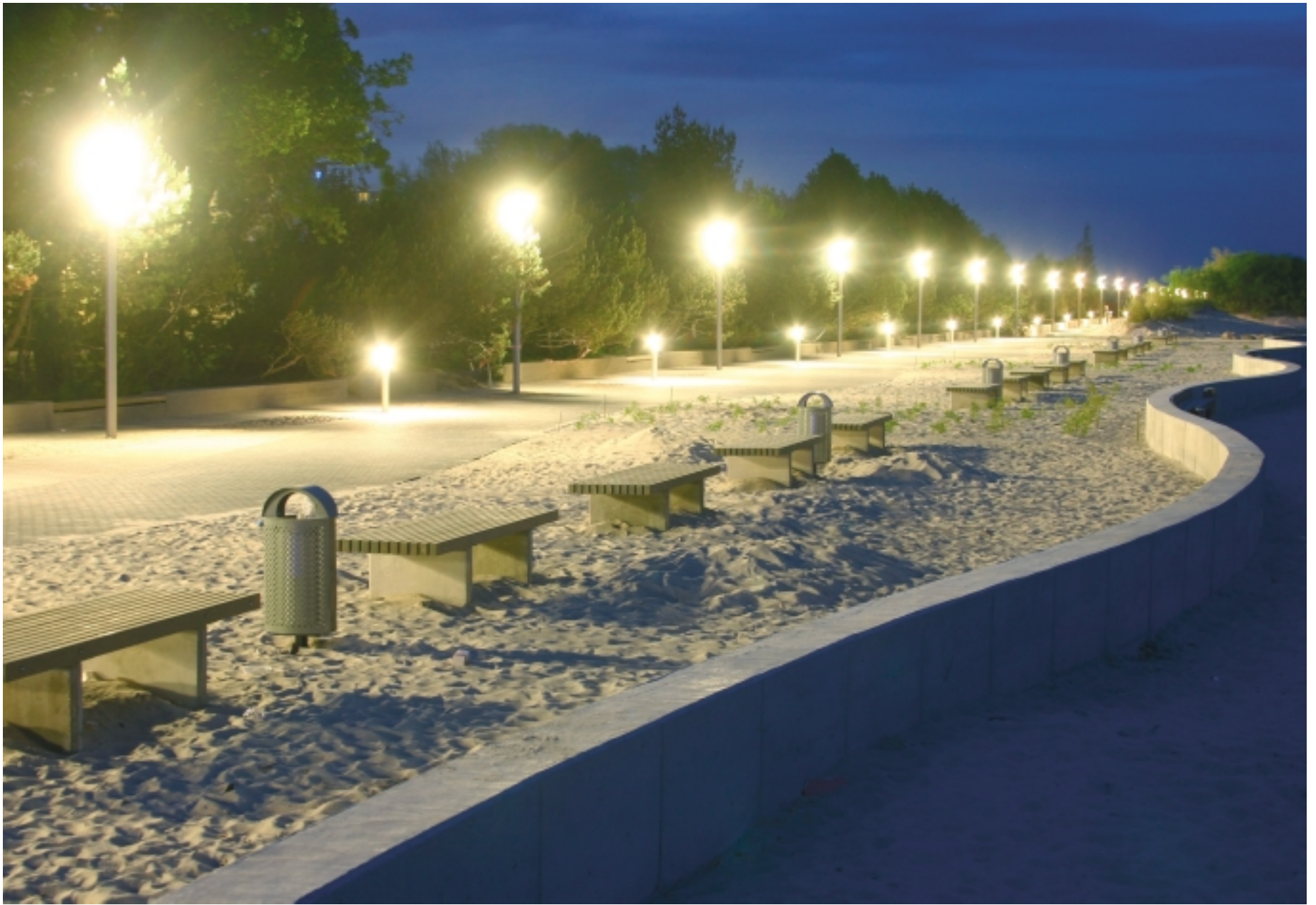
Õhtuhämaruses valgustatud promenaad.

Eelkõige on rannapromenaad linnale täiesti teine tase. Uuenenud miljöö on jõuliseks arengumootoriks rannakaubandusele ja teenindusele. Selliste rajatiste tõelise väärtuse väljatoomis ei piisa rahanumbrite või sillutise ruutmeetrite kokkuarvamisest. Vaja on näha kaugemale ja sügavamale ning mitte ainult materiaalses maailmas. Väärt ideed, kavatsused, seisukohad, õiged mõtted ja