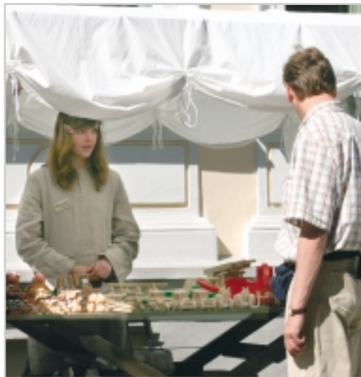
Suveniirimüüjad Rüütli tänaval ja tööd alustav müügikiosk rannas.