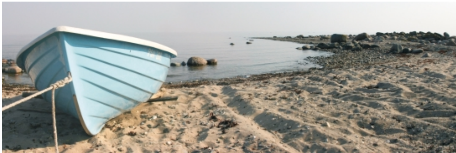
Loodava Sihtasutuse Pärnumaa Turism peacesmärgiks on tutvustada Pärnut ja Pärnu maakonda kui Läänemere regiooni tunde ja tunnustatud, ühtlaselt ning terviklikult arenenud puhke- ja turismiregiooni.

Turism valdades areneb isesuguses tempos ja laadis. On valdasid, kus turism on prioriteet