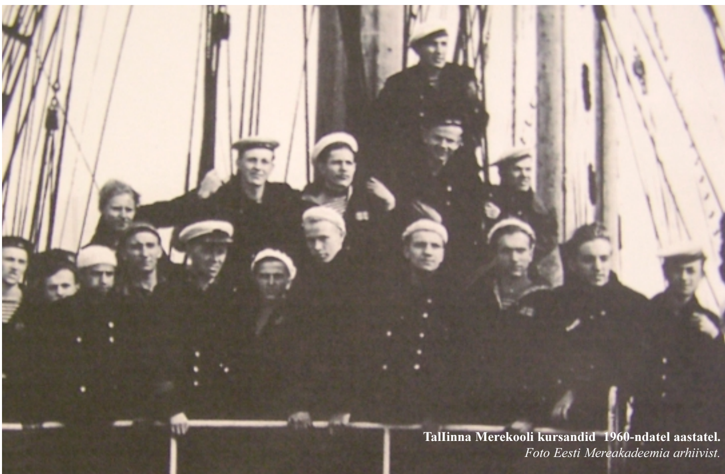
Tallinna Merekooli kursandid 1960-ndatel aastatel.

Pärnu Linnavalitsus kavandab koostöös Eesti Mereakadeemia ning Teadus- ja Haridusministeeriumiga asutada Pärnusse kaasaegse merekooli, kuhu tuuakse sisse ka riigieelarvelised kohad.