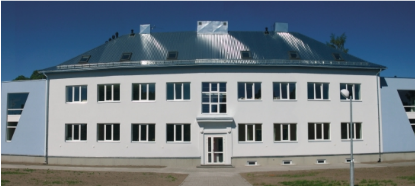
Riia mnt 70 hoone

Alates 1. juulist hakkab tegutsema jõusaal ja algavad füsioterapeudi liikumistunnid neile puudega täiskasvanutele, kes oma keha eest hoolt kanda